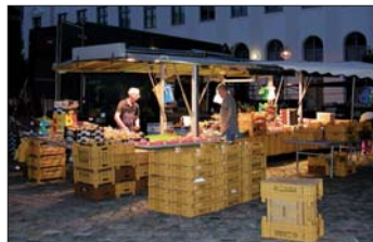
Nachts um 3 Uhr wurden die ersten Stände für den Wochenmarkt aufgebaut.