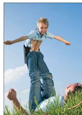
Anreize für ein gesünderes Leben: Bis zu 30 Euro Prämie jährlich erhält jeder Teilnehmer beim AOK-Familienbonus.

und neun Jahren gibt es für jeden Teilnehmer auch einen zusätzlichen Treubonus in Höhe von 60 Euro. „Das ist eine gute Investition in die Zukunft und die Gesundheit der ganzen Familie. So ist der Führerschein für den Nachwuchs oder der Urlaub schnell verdient“, so AOK-Geschäftsstellenleiter Bojens. Mehr Infos zum neuen AOK-Familienbonus gibt es in den AOK-Servicestelle bei unter 04102 801-0.