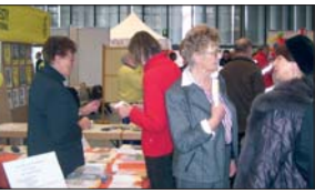
Bei der Ehrenamtsmesse am vergangenen Samstag in